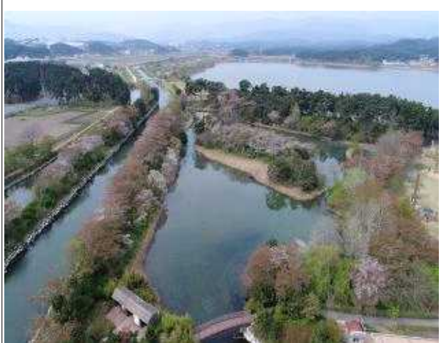
강릉 경포호(복원 후)