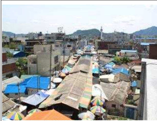
춘천 약사천(복원 전)