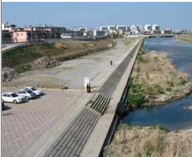
강릉 남대천(복원 전)