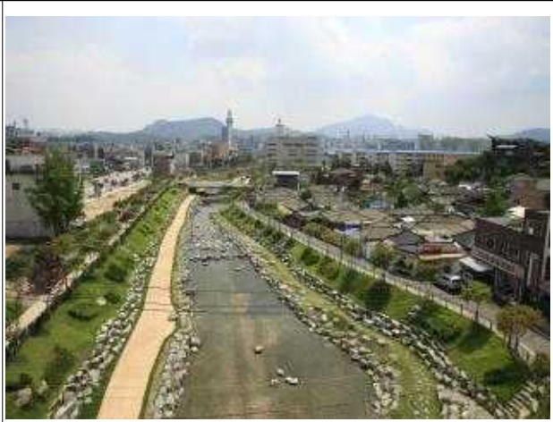
춘천 약사천(복원 후)