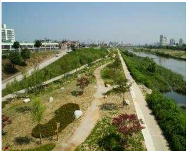
강릉 남대천(복원 후)